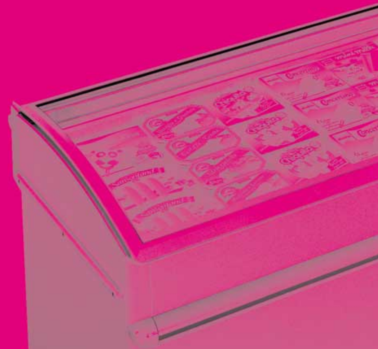
Stampa Faggiolato - Printed in Italy - DP000190 rev. 00 - 10/01 - 3.000