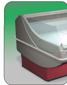
Version LS LS version Version LS LS Version Version LS Versão LS