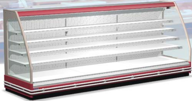
Spalle panoramiche Panoramic ends Joues panoramiques Panorama seitenteile Laterales panorámicos Laterais panorámicas

Novo móvel semivertical aberto que, graças às suas dimensões em altura (150 e 1055 cm) e na profundidade (855 cm), se propõe para novas soluções de lay-out do local de vendas. A disponibilidade de quatro comprimentos para os bancos lineares e de três diversos móveis à cabeceira, torna este produto particularmente adequado na formação de ilhas de vendas onde a exposição dos produtos goza de todas aquelas características e vantagens típicas dos bancos murais e onde para o Cliente fique intacta a visibilidade do interior supermercado valorizando ao máximo a comunicação. O design luminoso e as costas dotadas de amplas vidraças termo-isolantes, exaltam a visibilidade do produto exposto. As soluções construtivas o tornam idóneo à conservação em classe H de fruta, verdura, ensacados e laticínios e em classe M de carnes e frangos préconfeccionados.