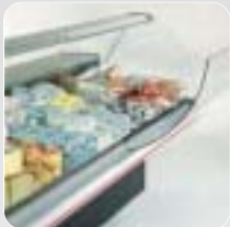
Vetri ribaltabili verso il basso Downward swinging glasses Vitres basculants en bas Nach unten schwenkbaren, gebogenen Frontscheiben Cristales abatibles