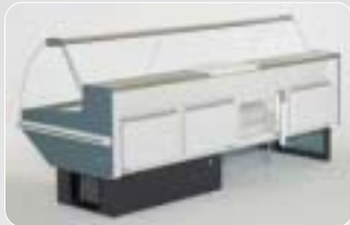
Riserva refrigerata Refrigerated-storage Réserve frigorifère Unterbauek hlung Reserva refrigerada