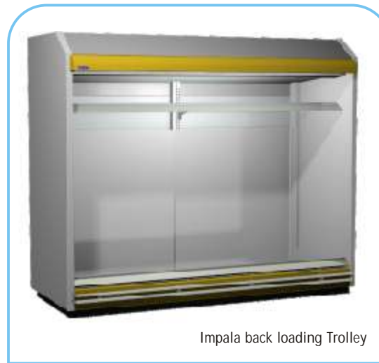
Impala back loading Trolley

Nuevo mueble para cargar por detrás, ideal para estaciones de servicio y equipado con puertas traseras corredizas. Disponible en dos versiones: con carros (trolley version) o con estantes (shelves version). Por medio del kit correspondiente es posible transformar con facilidad la versión con carros en la versión con estantes.