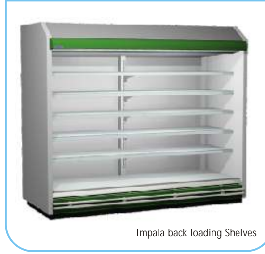
Impala back loading Shelves