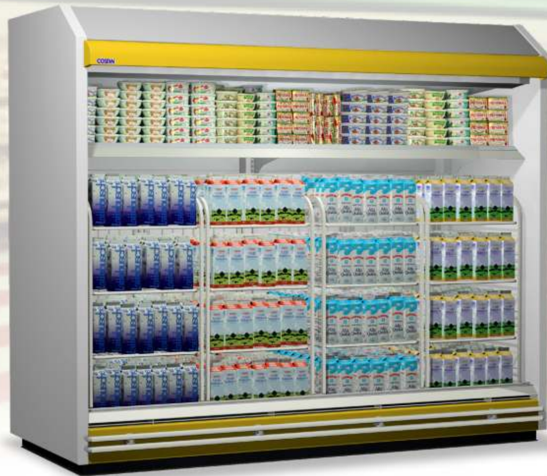
Impala back loading H20-22 Shelves

New cabinet to be loaded from the back, ideal for petrol stations and equipped with rear sliding doors. Available in two versions: with trolleys (trolley version) or shelves (shelves version). By the use of an ad-hoc kit the trolley version can easily be converted into the shelf version.